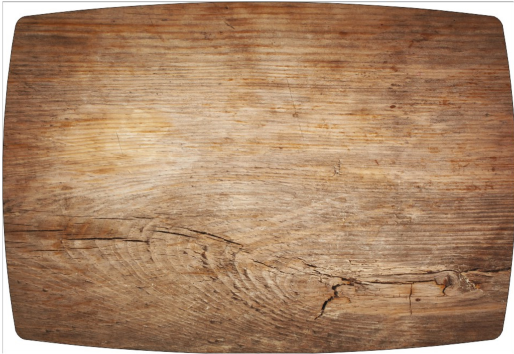
Рисунок 1: ДУБ НАТУРАЛЬНЫЙ