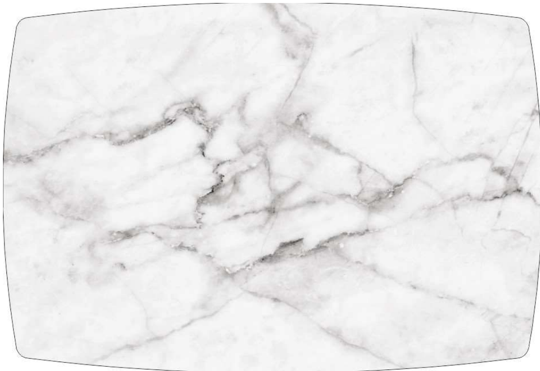
Рисунок 6: БЕЛЫЙ МРАМОР