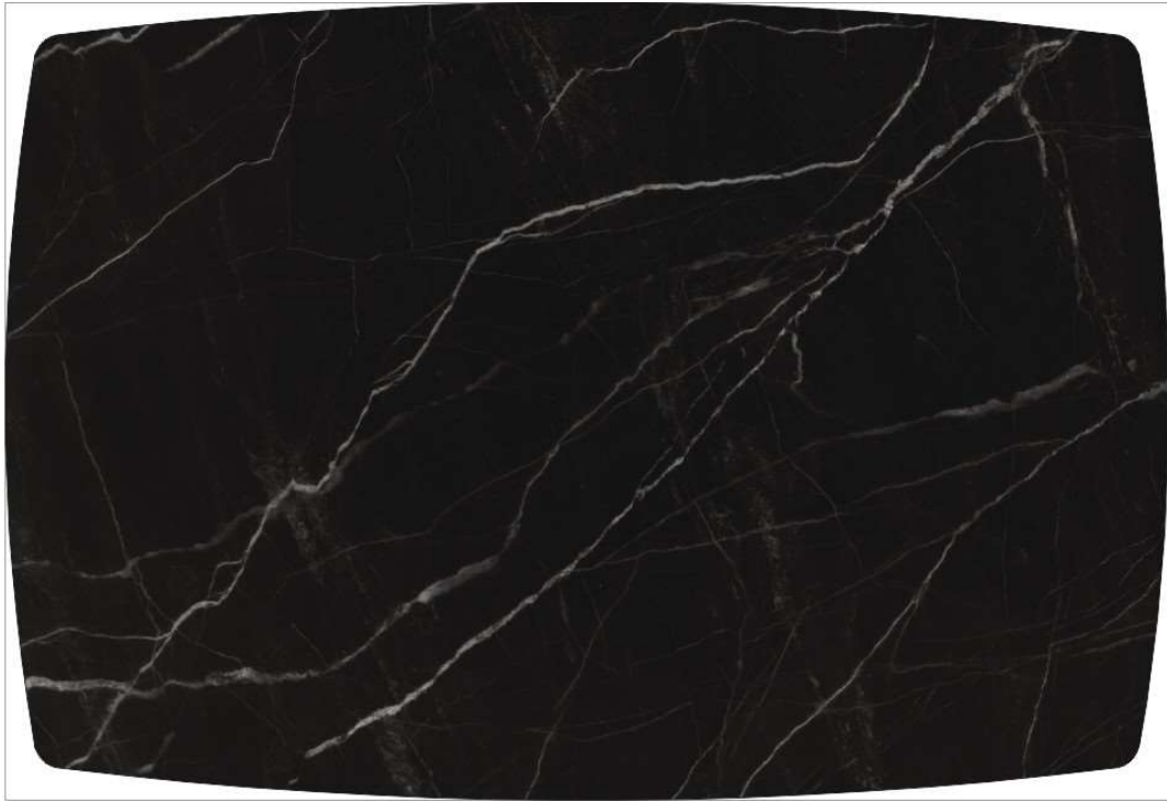
Рисунок 5: ЧЁРНЫЙ МРАМОР