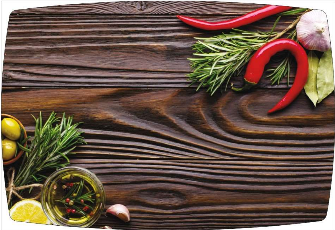
Рисунок 3: РОЗМАРИ