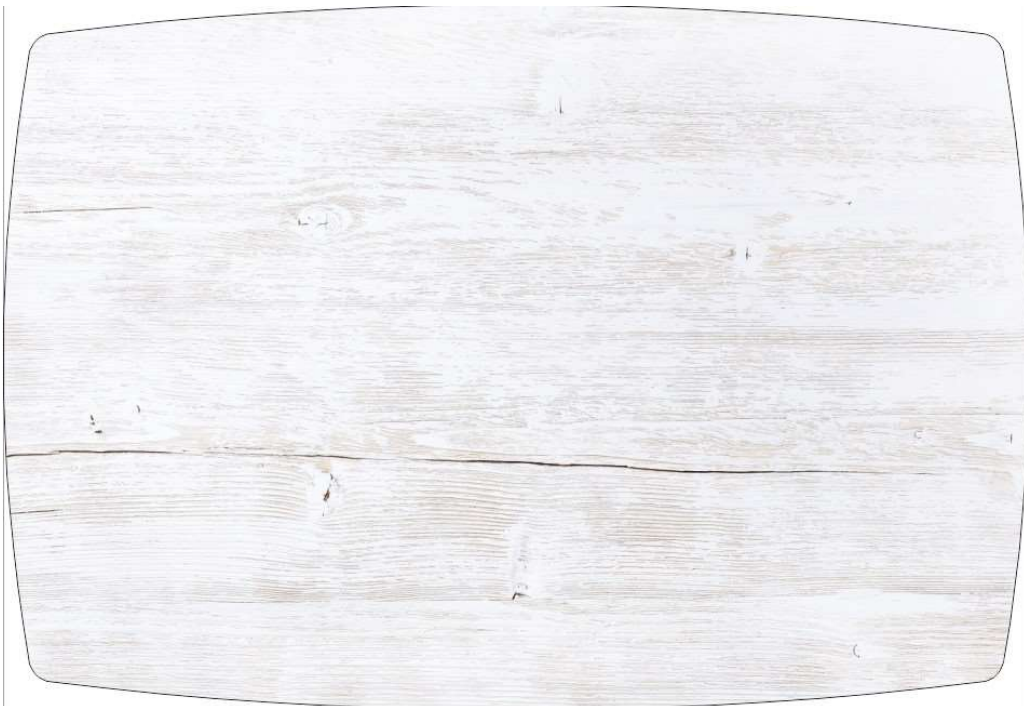
Рисунок 2: СВЕТЛОЕ ДЕРЕВО