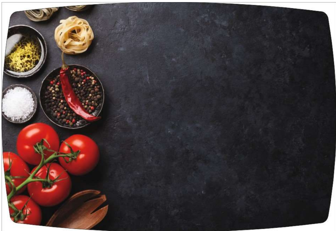
Рисунок 4: PEPPER MIX